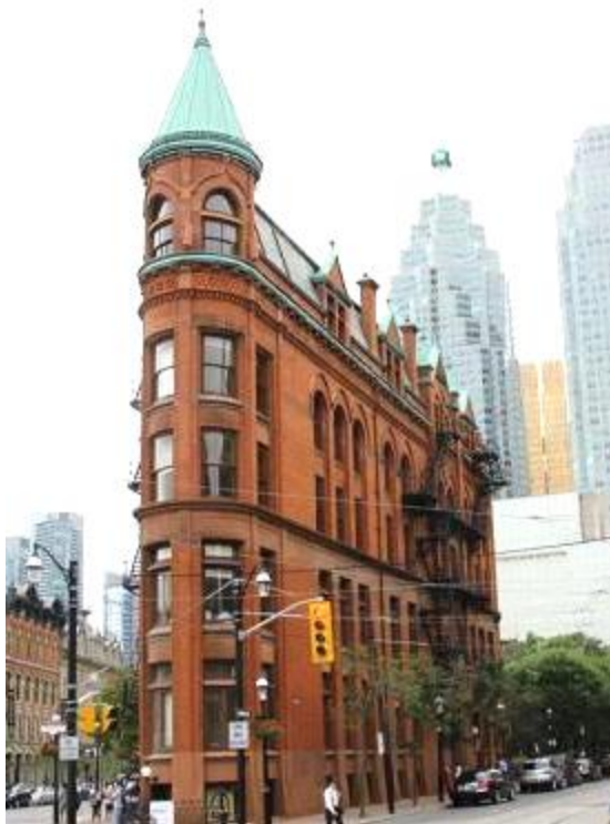
APT Convention – Montreal Italian Pavillion