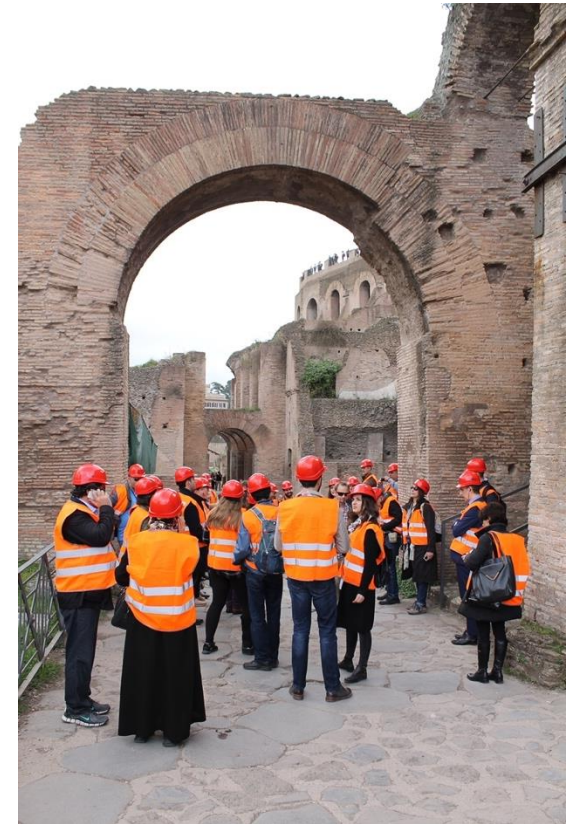
Restoration Week 2025 20°edition