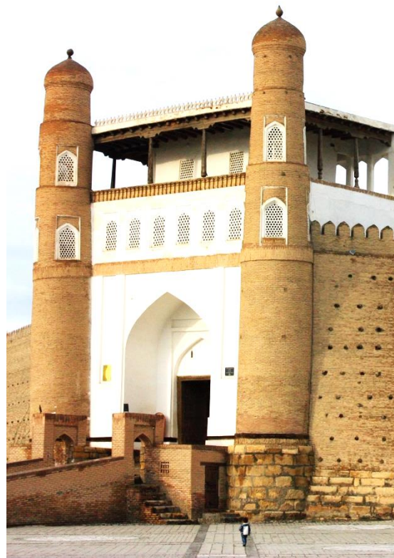
Centre for Restoration Italy/Uzbekistan