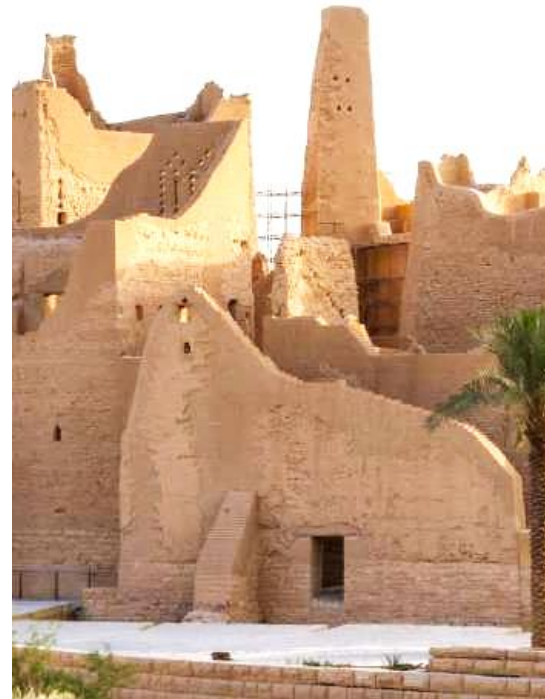
International Exhibition Restoration – Ryiad KSA